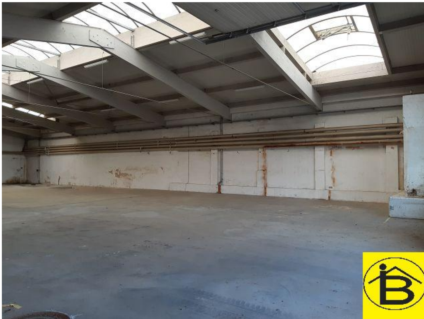
K-1_HG 06_Top 2