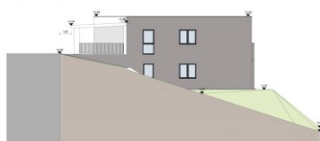
ANSICHT NORD M 1:100