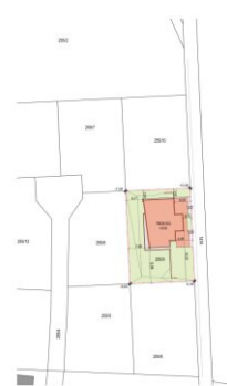
LAGEPLAN M 1:500