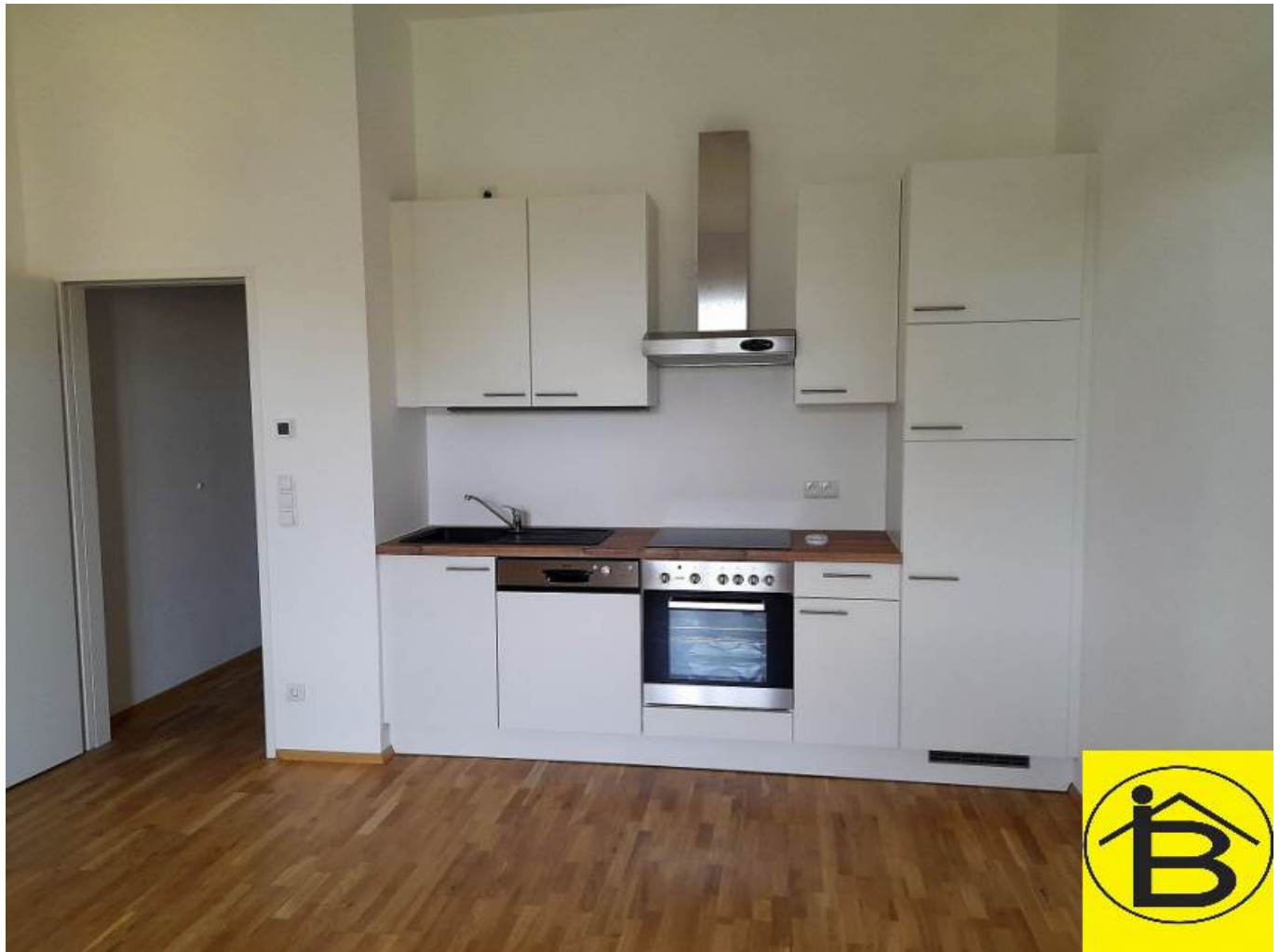
Top 21 Küchenblock