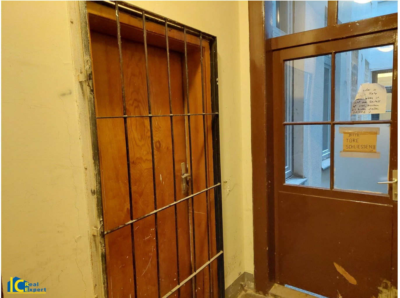
Türe zu Top 2

Objektnummer: 7603/525 Eine Immobilie von IC-Makler