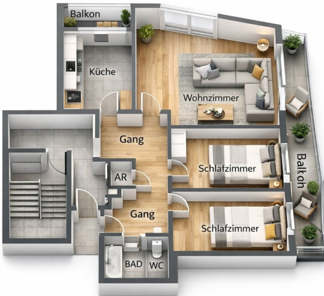
Unverbindlicher Einteilungsplan | Top 23 | Schützenstraße 46g | Innsbruck