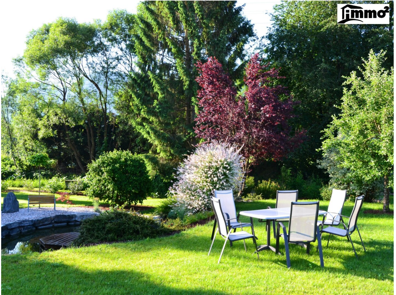
Toller, parkähnlicher Garten