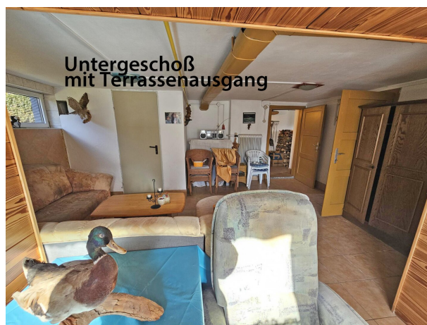
Untergeschoß mit Terrassenausgang