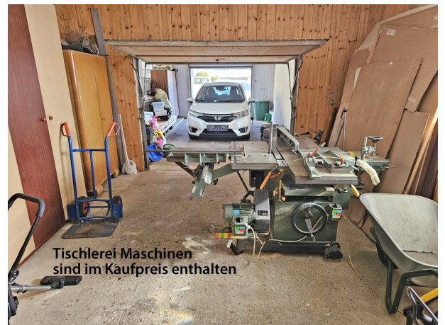
Tischlerei Maschinen sind im Kaufpreis enthalten