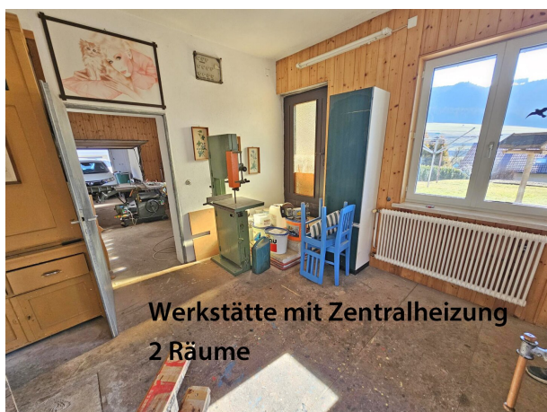
Werkstätte mit Zentralheizung 2 Räume