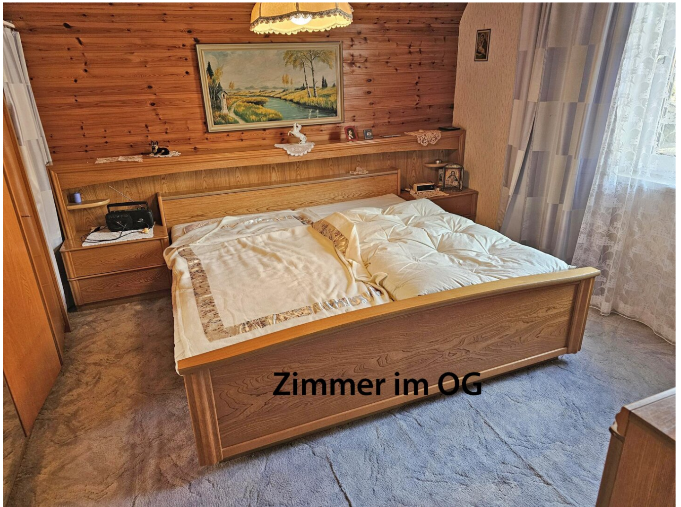
Zimmer im OG