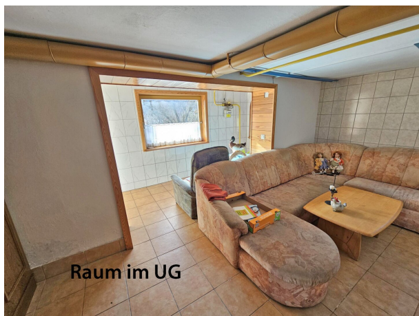
Raum im UG