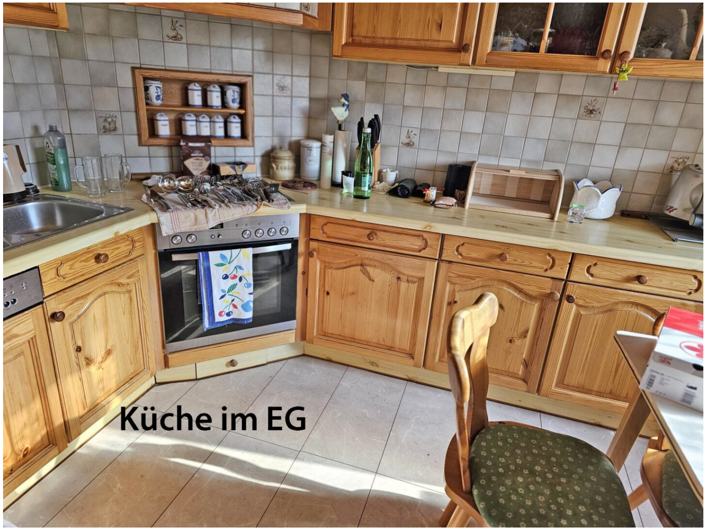
Küche im EG