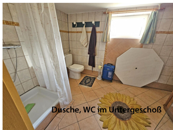
Dusche, WC im Untergeschoß