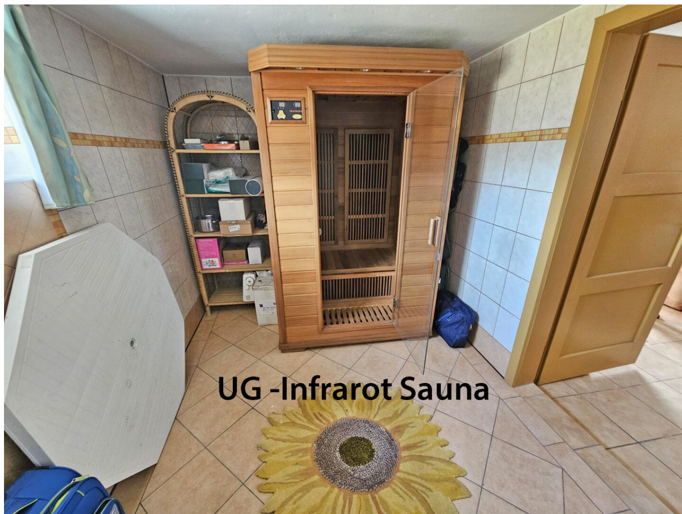
UG -Infrarot Sauna