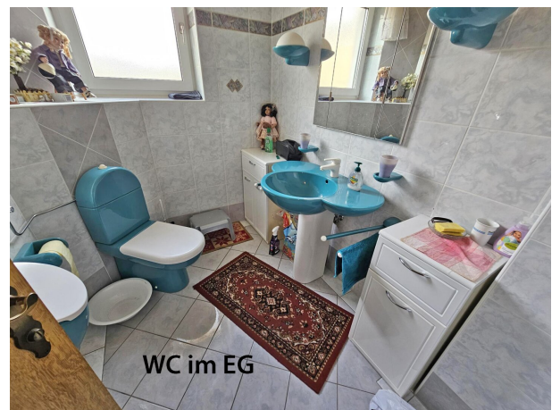
WC im EG