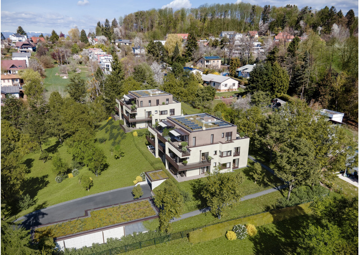
Luftschloss View 2