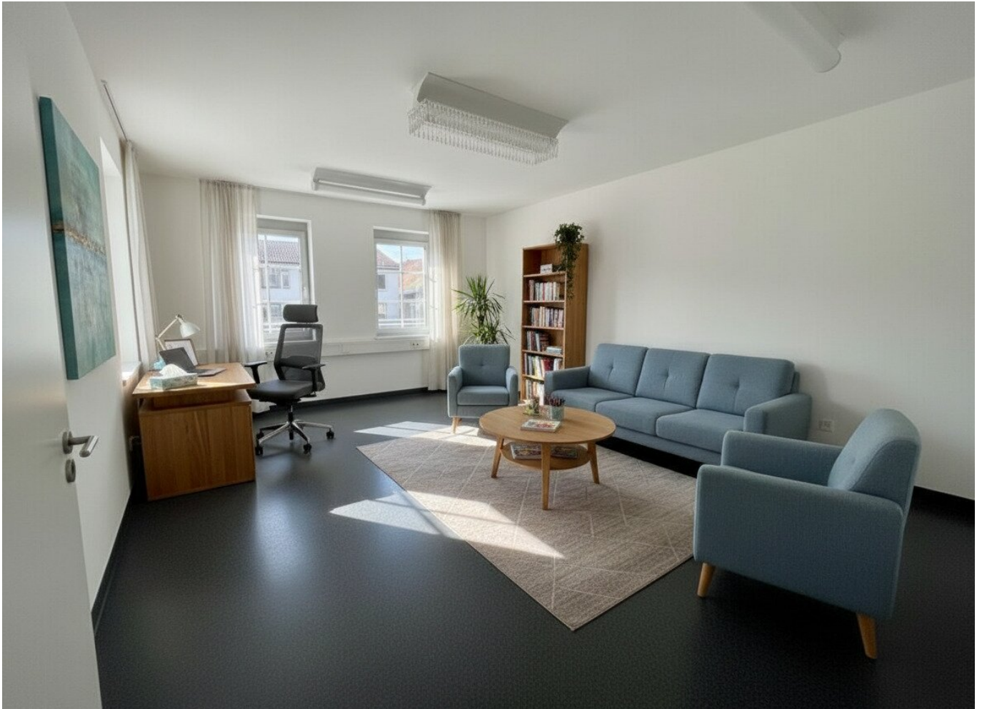
Praxisraum - Beispielbild