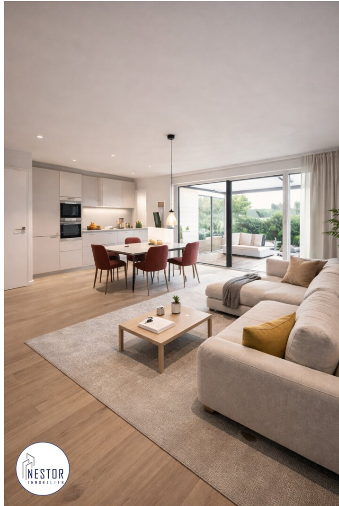
Haus - NESTOR Immobilien