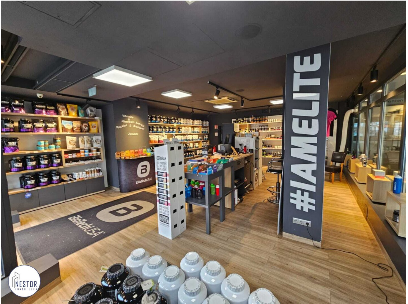
Geschäftslokal - NESTOR Immobilien

6,3 % Netto-Rendite - Moderne Geschäftsfläche in bester Lage!