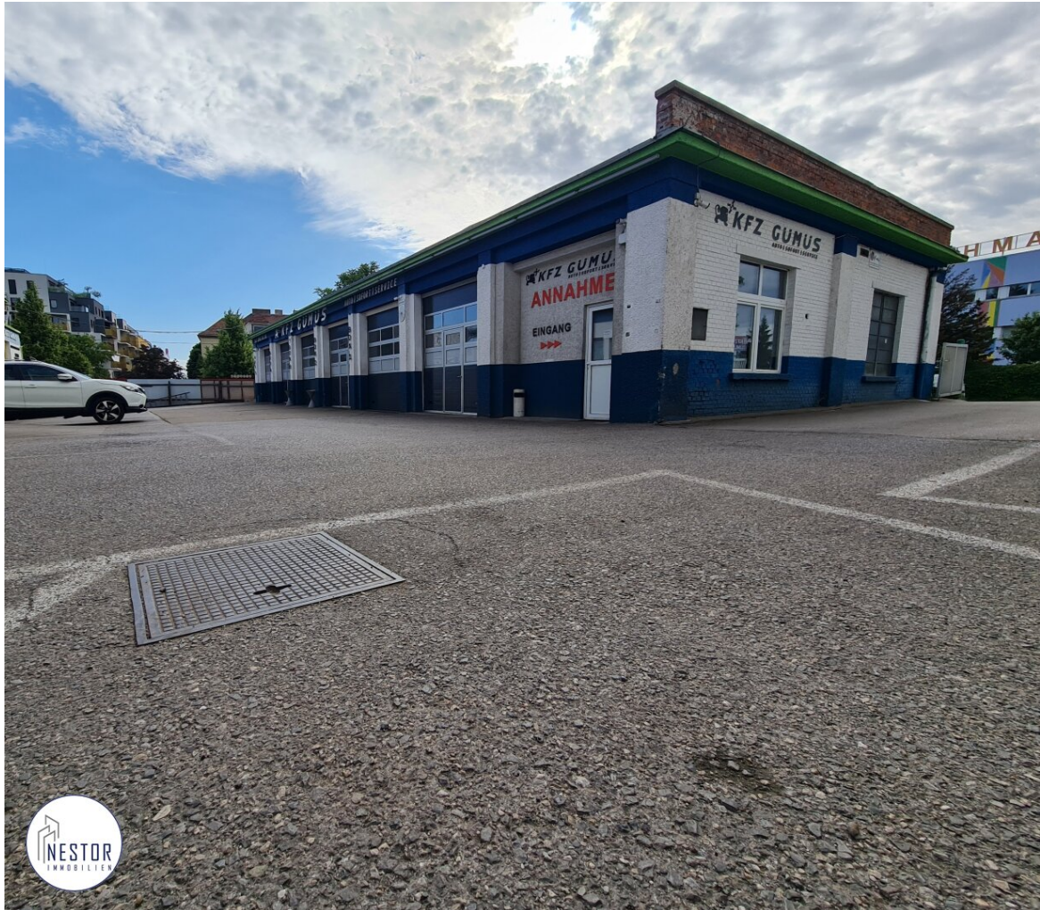
Werkstatt - NESTOR Immobilien