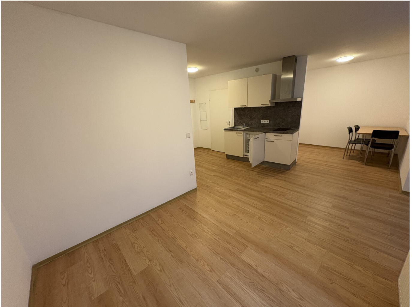
Wohnküche Perspektive 1