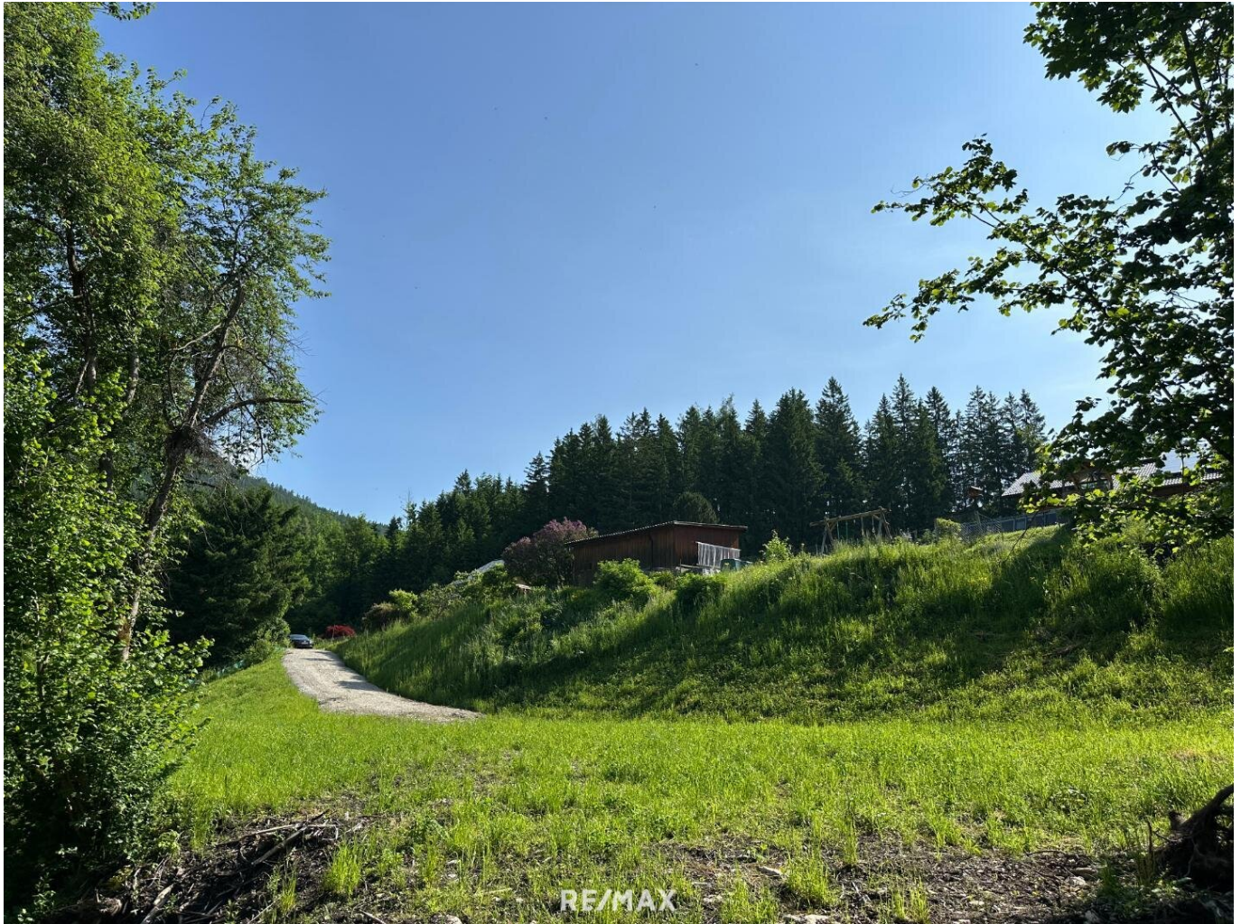
01_Sicht gegen Norden