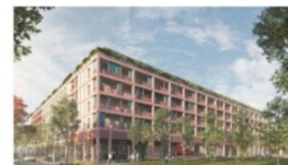
Smart City Graz

Die dargestellte Möblierung hat Symbolcharakter und stellt einen Einrichtungsvorschlag dar. Die Einrichtungsgegenstände sind - ausgenommen Küche, Badewanne und / oder Dusche, Waschtisch und WC - nicht Bestandteil der Wohnung. Vor Möbelbestellungen sind Naturmaße zu nehmen. Druck- und Satzfehler, sowie Irrtümer und baulich bedingte Änderungen vorbehalten. Die Wohnungsgrößen sind Circa - Angaben und können sich durch die Detailplanung geringfügig ändern. Maßgeblich ist in jedem Fall der Mietvertrag.