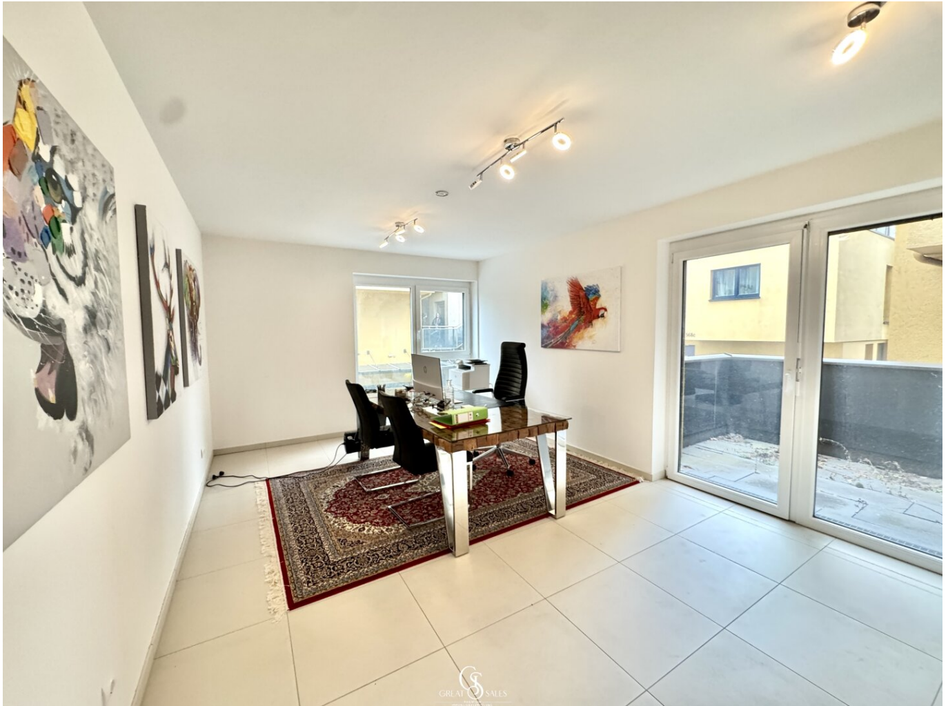
Wohn-Ess & Arbeitszimmer