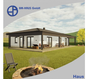
Haus Carina 100 Schlüsselfertig inkl. Bodenplatte