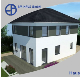
Haus Linda 92 Schlüsselfertig inkl. Bodenplatte