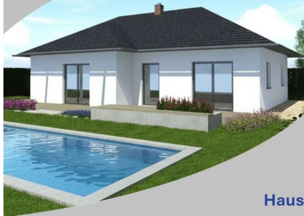
Haus Clara 106 Schlüsselfertig inkl. Bodenplatte