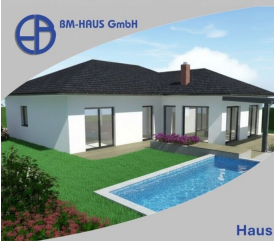
Haus Sarah 127 Schlüsselfertig inkl. Bodenplatte