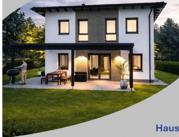
Haus Bella 114 Schlüsselfertig inkl. Bodenplatte