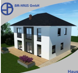
Haus Helena 146 Schlüsselfertig inkl. Bodenplatte