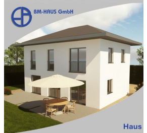
Haus Bianca 116 Schlüsselfertig inkl. Bodenplatte