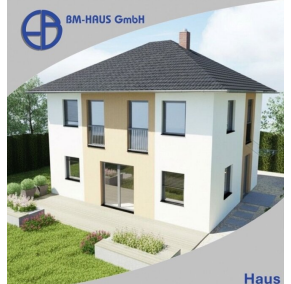
Haus Iris 111 Schlüsselfertig inkl. Bodenplatte