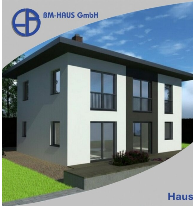
Haus Leona 125 Schlüsselfertig inkl. Bodenplatte