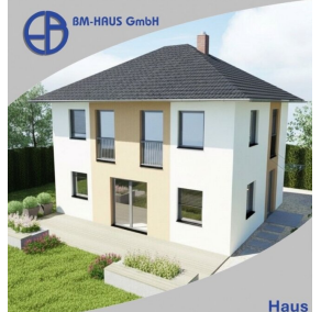
Haus Iris 111 Schlüsselfertig inkl. Bodenplatte