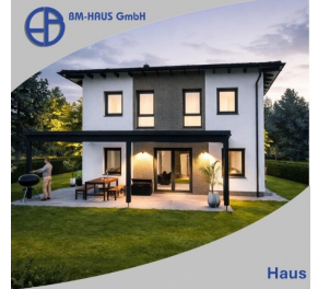
Haus Bella 114 Schlüsselfertig inkl. Bodenplatte