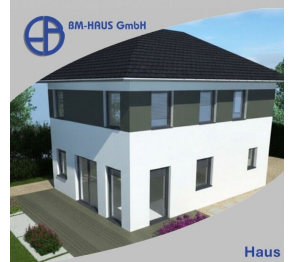
Haus Linda 92 Schlüsselfertig inkl. Bodenplatte