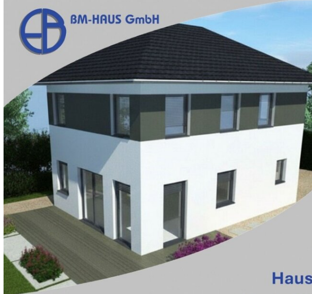
Haus Linda 92 Schlüsselfertig inkl. Bodenplatte