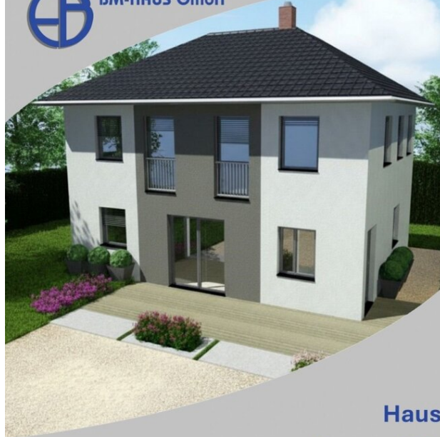
Haus Donna 111 Schlüsselfertig inkl. Bodenplatte