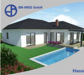
Haus Sarah 127 Schlüsselfertig inkl. Bodenplatte