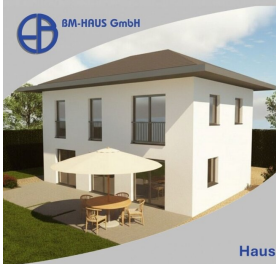
Haus Bianca 116 Schlüsselfertig inkl. Bodenplatte