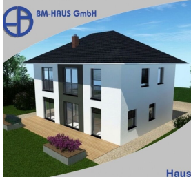
Haus Helena 146 Schlüsselfertig inkl. Bodenplatte