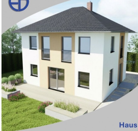
Haus Iris 111 Schlüsselfertig inkl. Bodenplatte