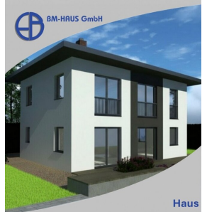
Haus Leona 125 Schlüsselfertig inkl. Bodenplatte