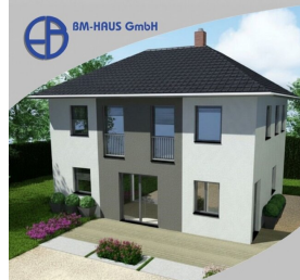
Haus Donna 111 Schlüsselfertig inkl. Bodenplatte