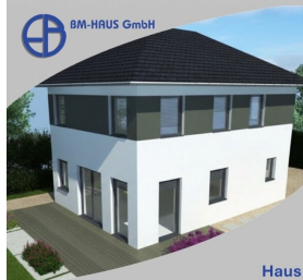
Haus Linda 92 Schlüsselfertig inkl. Bodenplatte