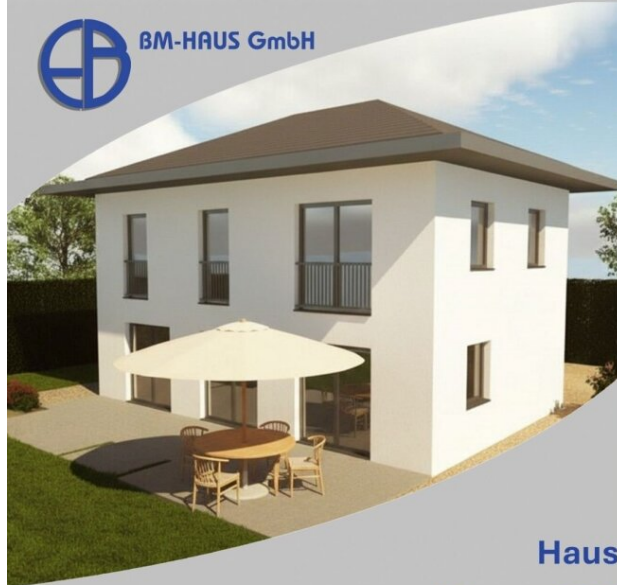
Haus Bianca 116 Schlüsselfertig inkl. Bodenplatte