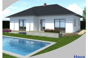
Haus Clara 106 Schlüsselfertig inkl. Bodenplatte