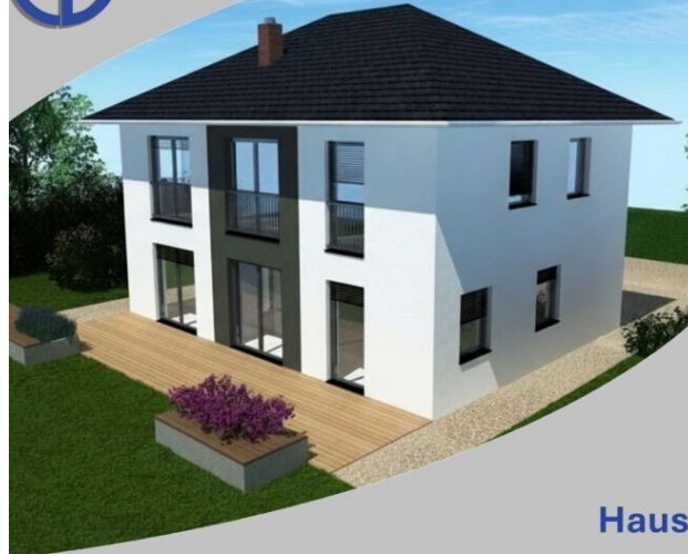
Haus Helena 146 Schlüsselfertig inkl. Bodenplatte