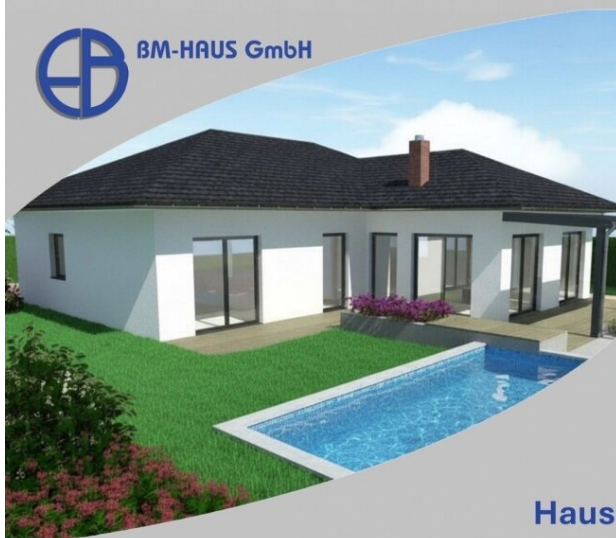
Haus Sarah 127 Schlüsselfertig inkl. Bodenplatte