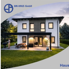
Haus Bella 114 Schlüsselfertig inkl. Bodenplatte