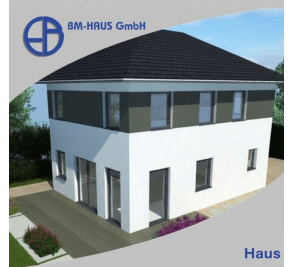
Haus Linda 92 Schlüsselfertig inkl. Bodenplatte