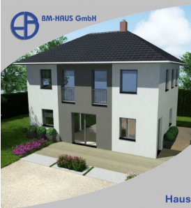
Haus Donna 111 Schlüsselfertig inkl. Bodenplatte