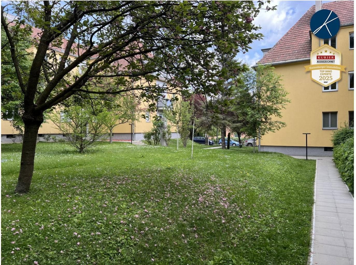
Wohnhausanlage im Grünen