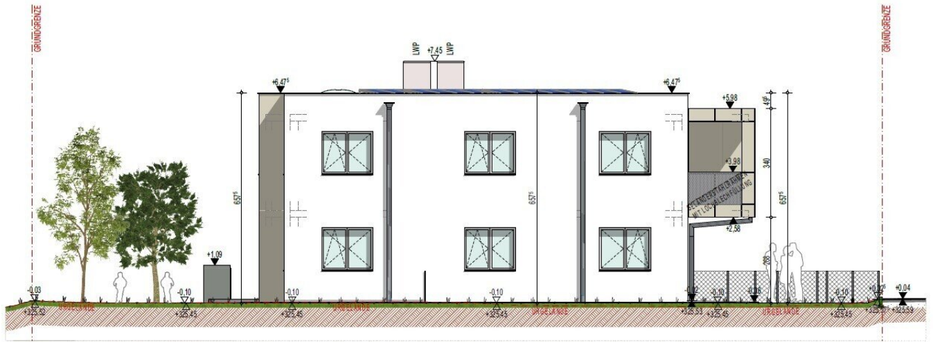
ANSICHT WEST 1:100