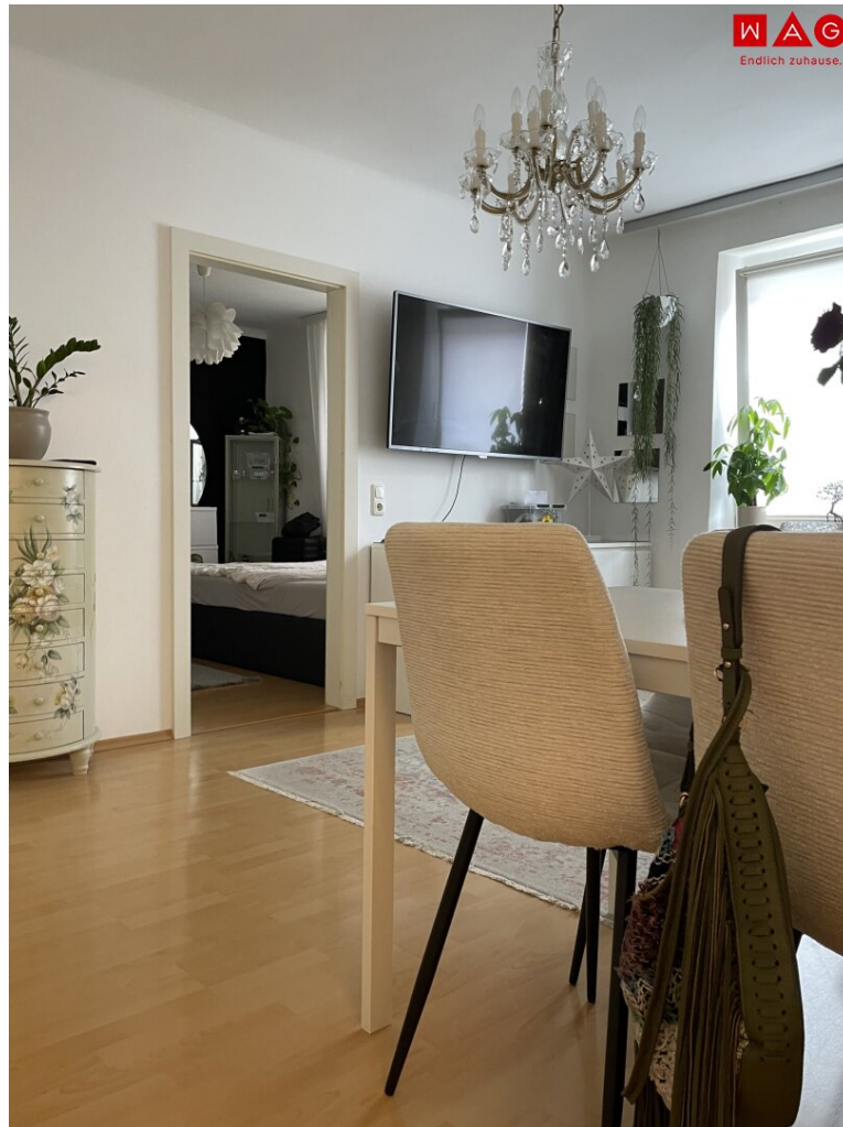
Wohn- und Esszimmer (Einrichtungsbeispiel)