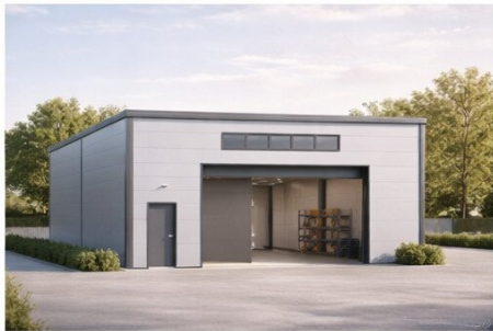
HALLE 2 Nutzfläche: 171,52 m 2