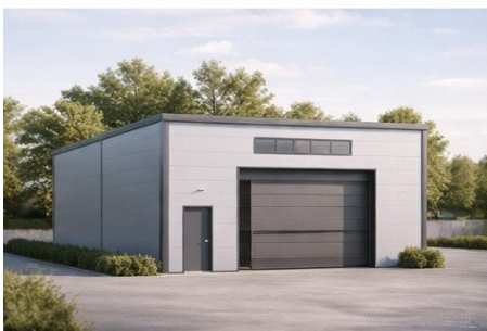
HALLE 1 Nutzfläche: 171,52 m 2