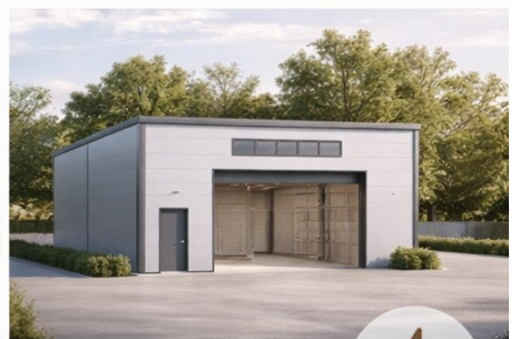
HALLE 3 Nutzfläche: 139,20 m 2