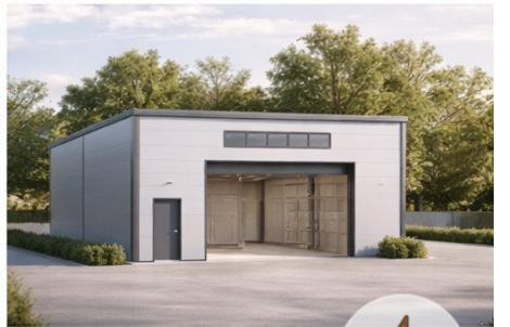
HALLE 3 Nutzfläche: 139,20 m 2