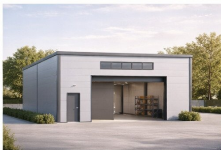
HALLE 2 Nutzfläche: 171,52 m 2