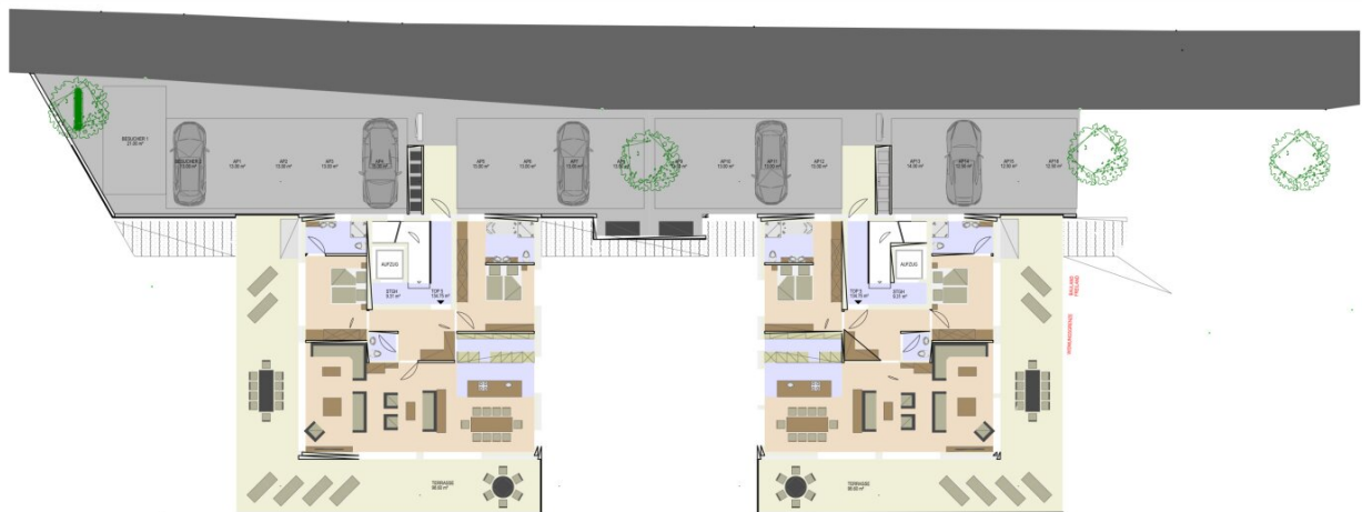
Haus A Penthousewohnung Top 5 Reserviert