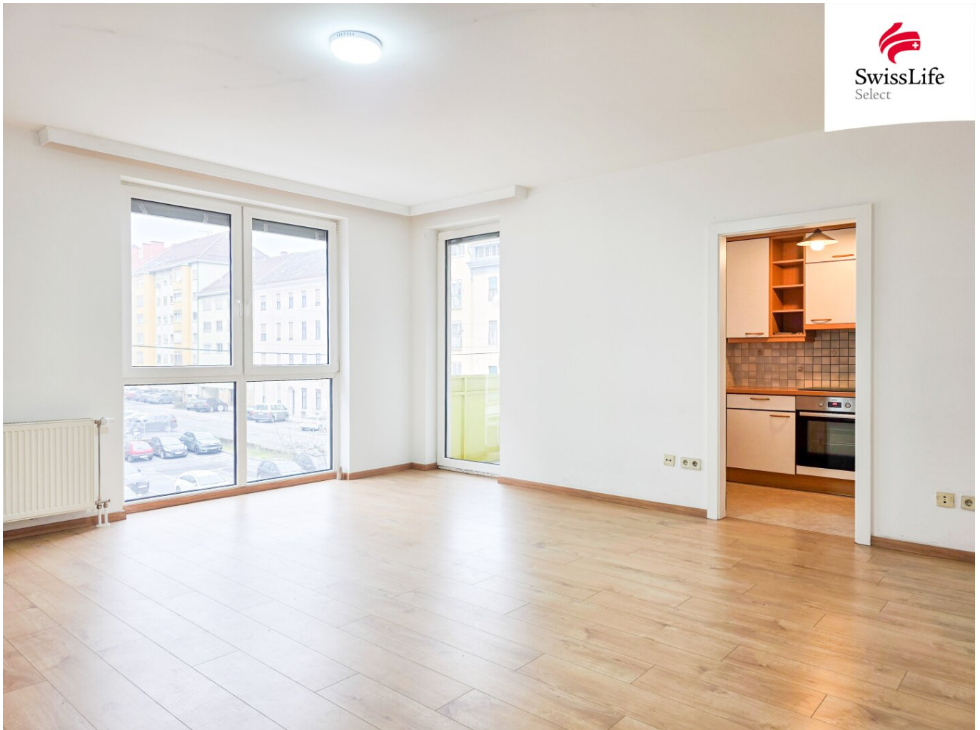
Wohnzimmer mit Blick zur Küche