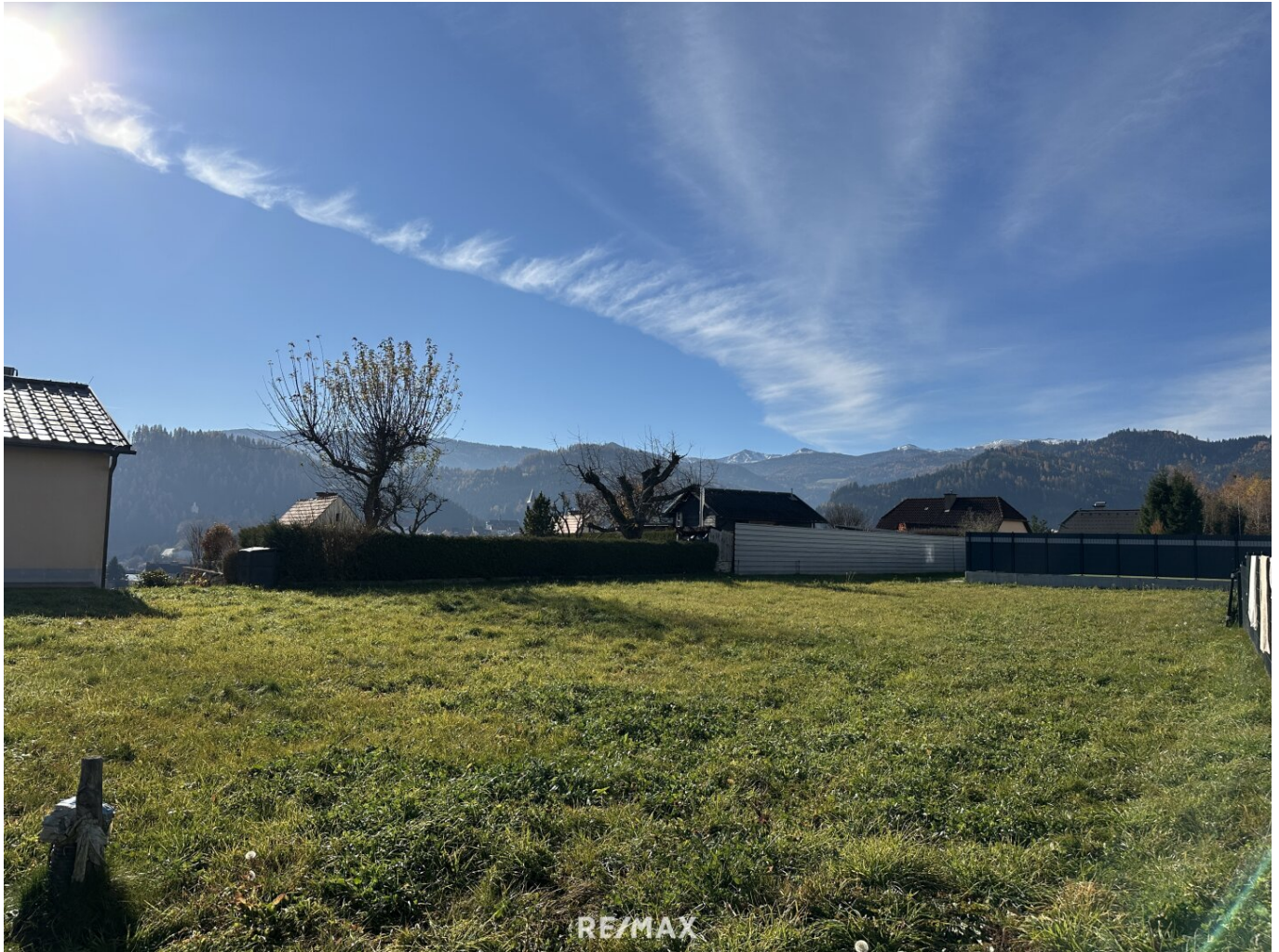
Grundstück in Judenburg