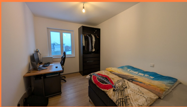
Die Cleveren Immobilienmakler©