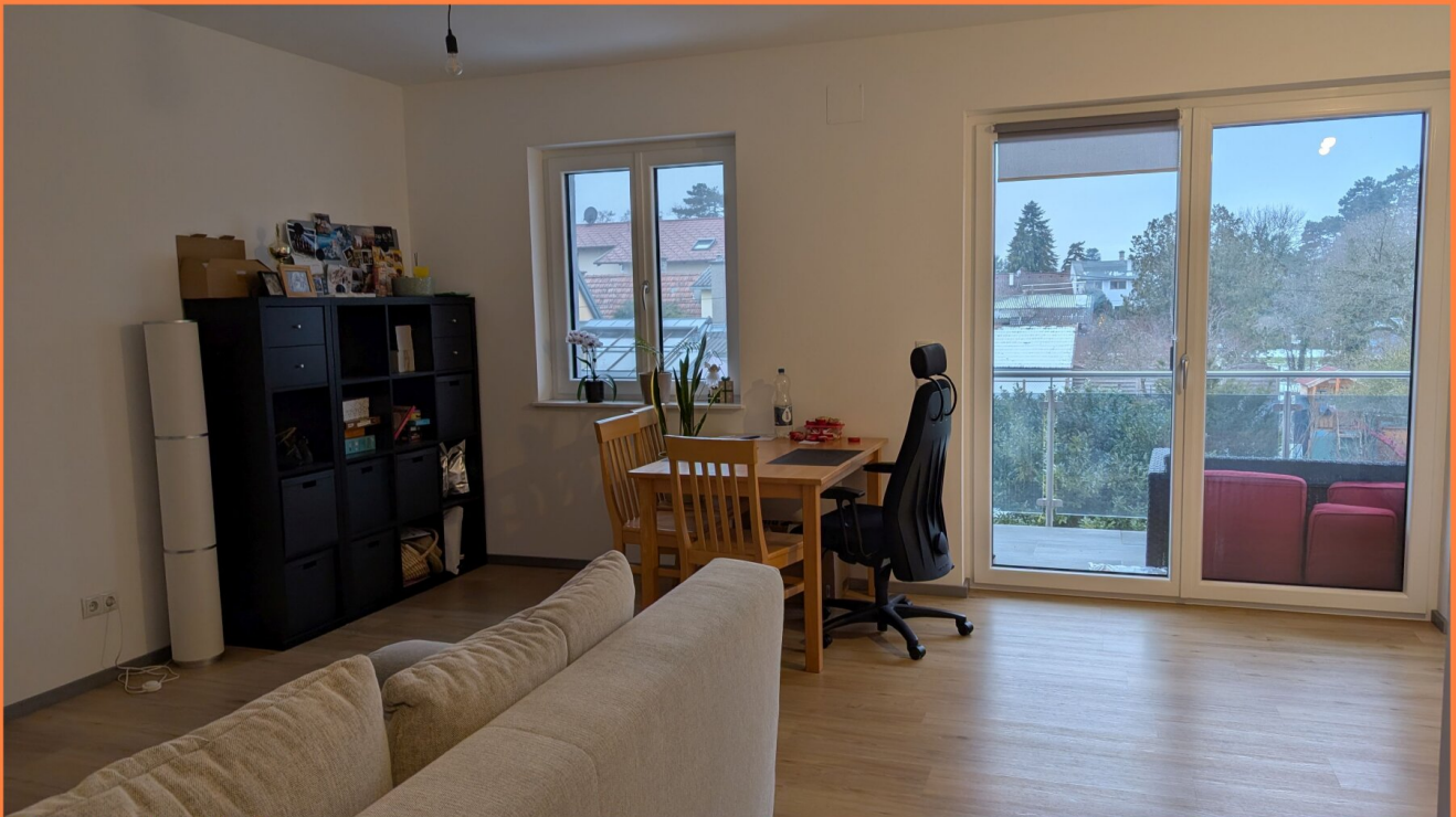
Die Cleveren Immobilienmakler©