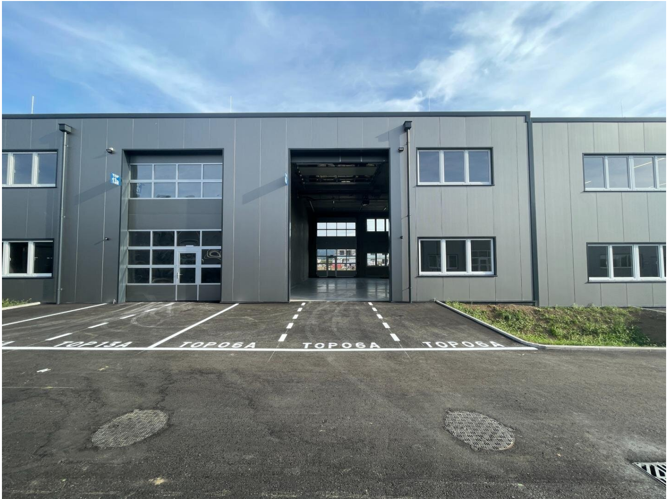
Titelbild Top 06a

SOFORTBEZUG! Betriebs-/ Produktions- oder Lagerhallen von 99 - 300 m 2 Fläche im Business Park Regau , 1A-Lage, Nähe A1 Westautobahn (Top 06a)