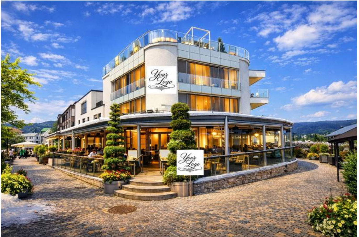
Villa in Velden