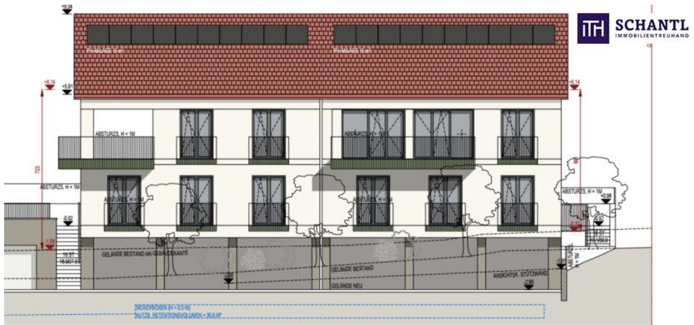
ANSICHT VON SÜD-OST / SCHNITT D-D 1:100