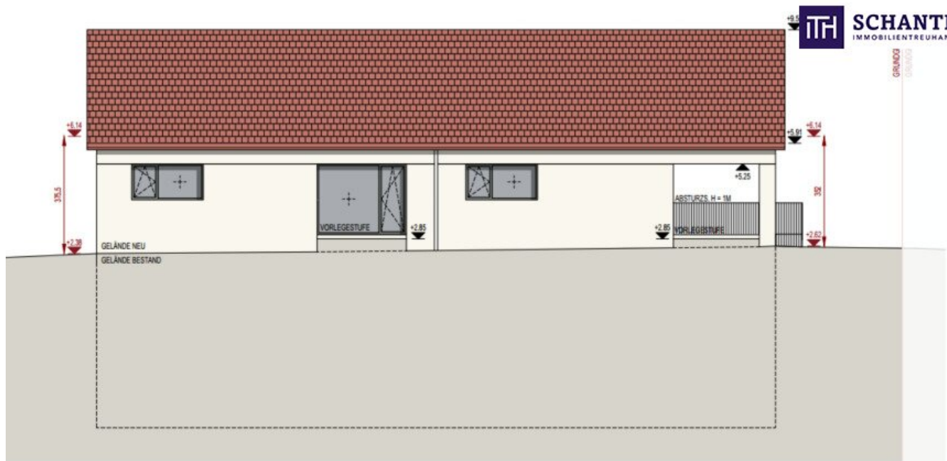
ANSICHT VON NORD-WEST 1:100