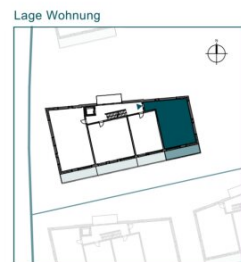
Top 5 // 1. OG // 3 Zimmer