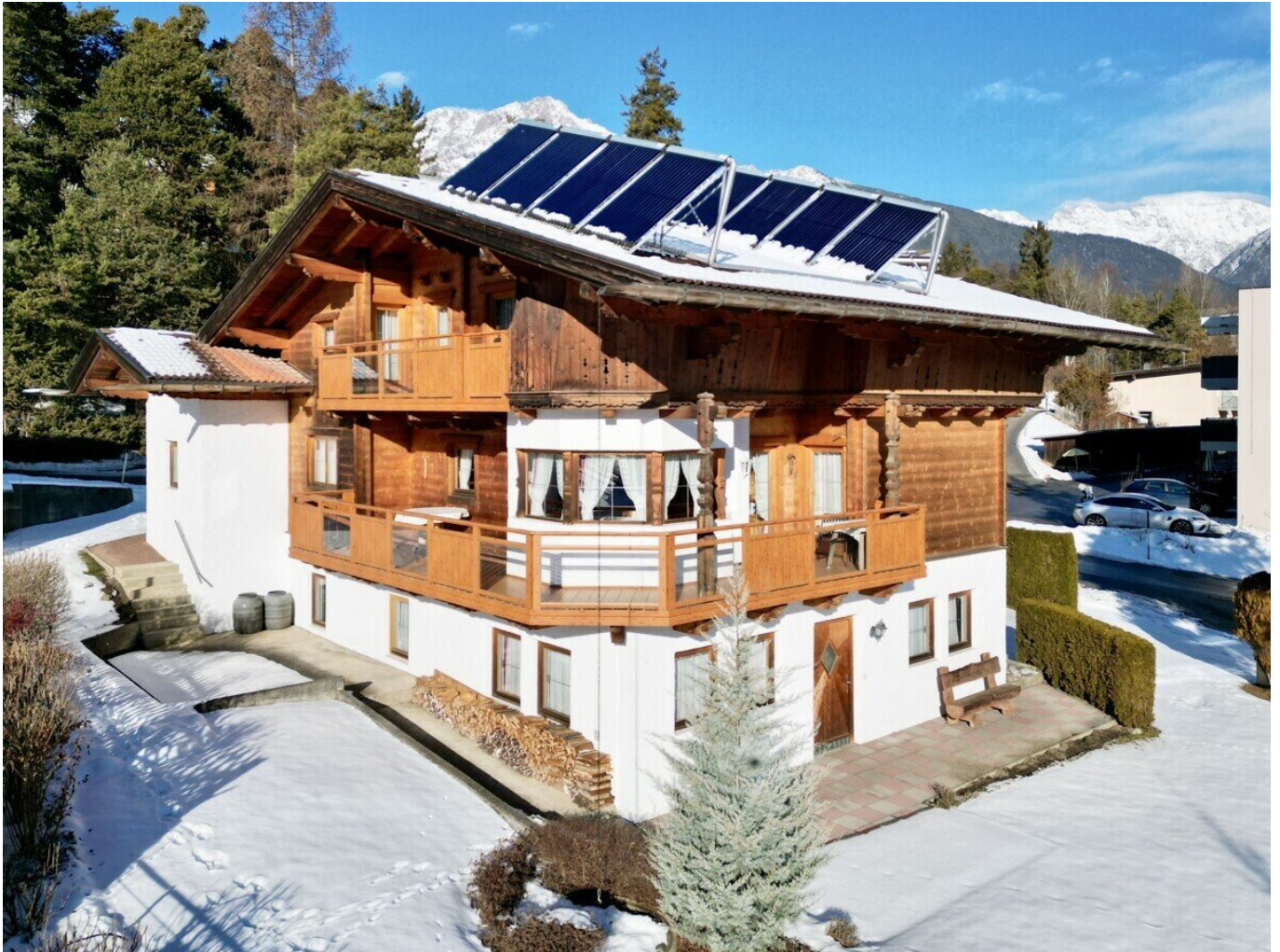
Drohnenaufnahme - Südost