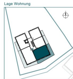
Top 10 // 2. OG // 3 Zimmer