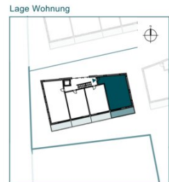
Top 8 // 2. OG // 3 Zimmer