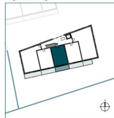
Top 13 // 2. OG // 2 Zimmer