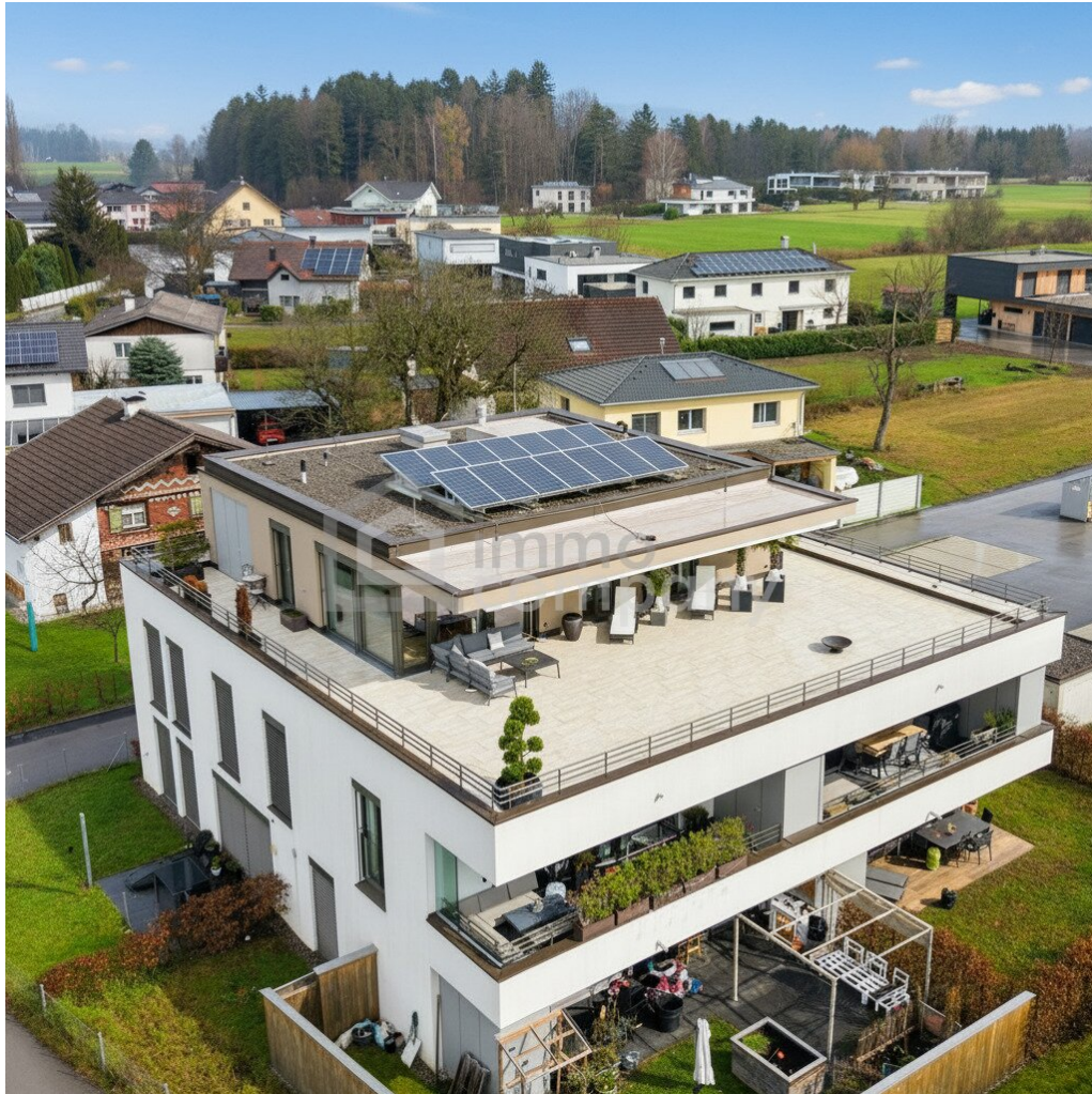
Penthouse - Terrasse 188m 2