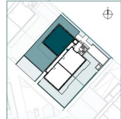
Top 3 // EG // 4 Zimmer