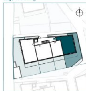
Top 1 // EG // 3 Zimmer