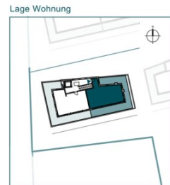
Top 12 // DG // 2 Zimmer