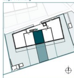
Top 3 // EG // 2 Zimmer