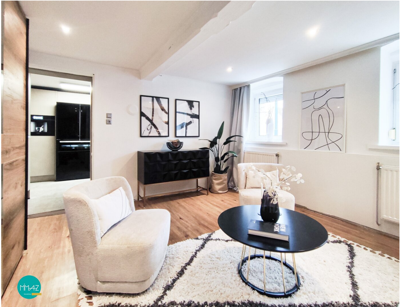
Wohnzimmer mit Blick in Küche

Wohnen auf einer Ebene! Vielseitiger Bungalow auf Eigengrund! 4 Zimmer I Doppelgarage I Gartenidylle! Lebensqualität pur!