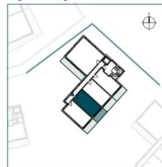
Top 9 // 2. OG // 1 Zimmer