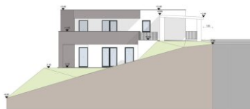
ANSICHT SÜD M 1:100