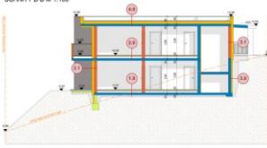
SNITT B-B M 1:100