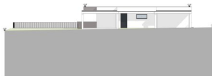
ANSICHT OST M 1:100