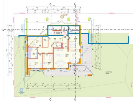
KELLERGEOSCHOSS M 1:100