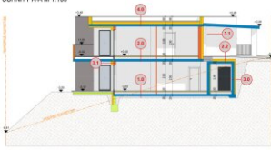
SNITT A-A M 1:100