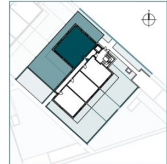
Top 4 // EG // 4 Zimmer