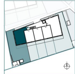
Top 5 // EG // 3 Zimmer