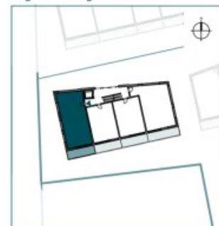
Top 11 // 2. OG // 3 Zimmer