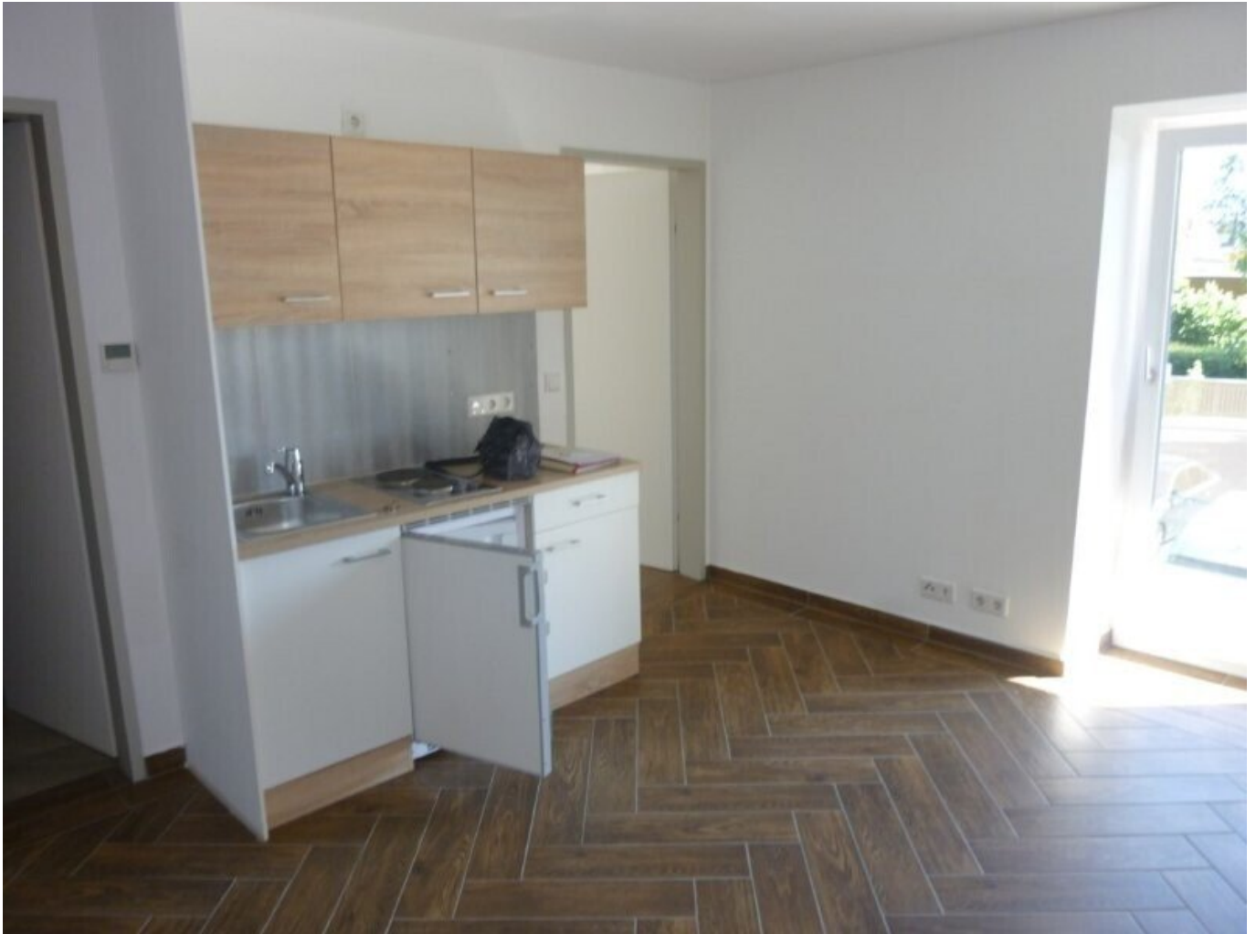
Wohnzimmer/Küche - Kleine Zimmer Wohnung mit Balkon Miete Grödig Salzburg