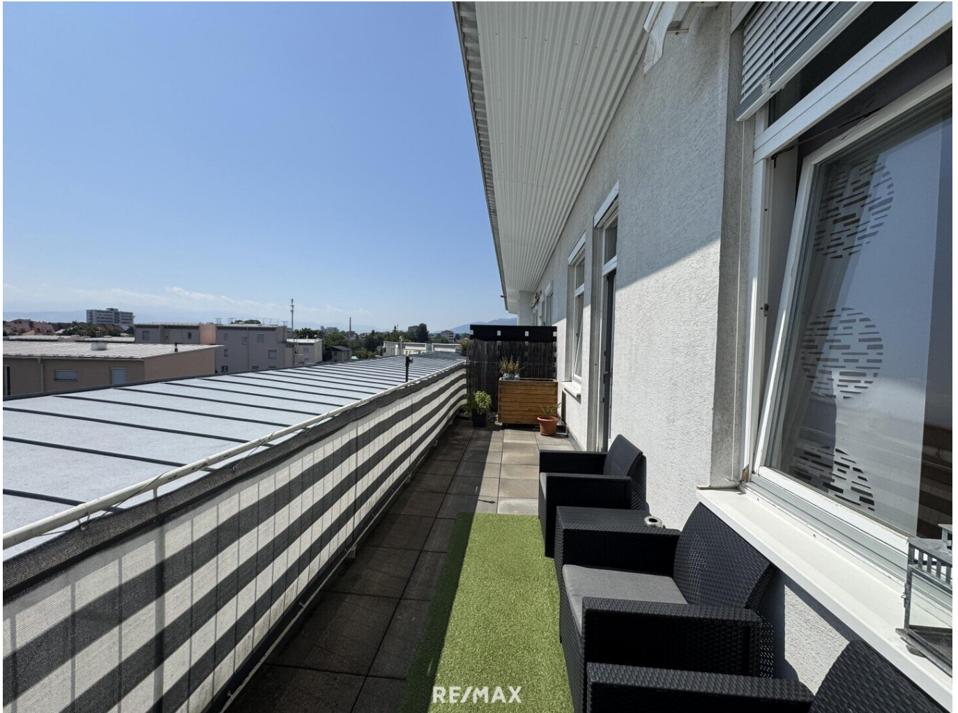
Aussicht von Terrasse

Objektnummer: 1679/1559 Eine Immobilie von RE/MAX Life