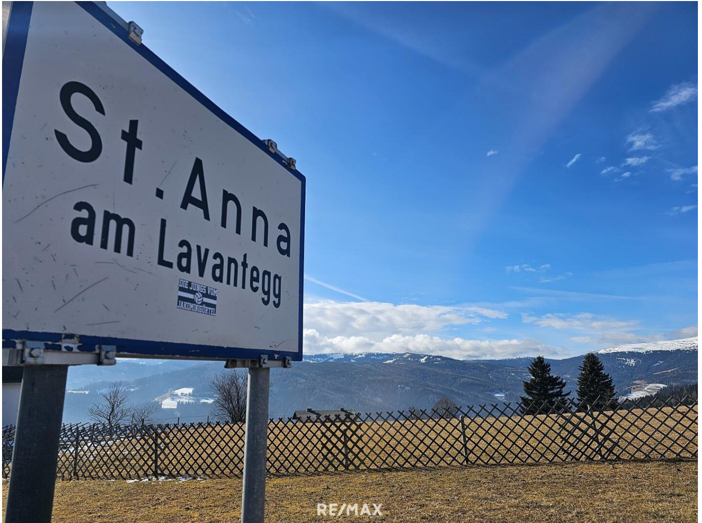
St. Anna am Lavantegg